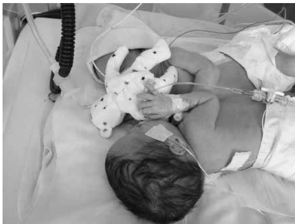
Rycina 5. Problemy pielęgnacyjne u zrosłaków

W przypadkach współistnienia u zrosłaków wad przewodu pokarmowego i konieczności założenia kolostomii, zwiększa się ryzyko wystąpienia zakażeń układu moczowego, zmian zapalnych skóry brzucha, szczególnie przy wystąpieniu biegunki. Sytuacje, w których niemożliwe staje się wykorzystanie przewodu pokarmowego do pokrycia zaopatrzenia płynowego i kalorycznego wymuszają konieczność wprowadzenia żywienia pozajelitowego, co stwarza kolejne trudności w leczeniu i pielęgnacji. Uzyskanie dostępu do naczyń centralnych i prawidłowa ich pielęgnacja wymaga dużo więcej wysiłku u zrosłaków niż u jednego dziecka, co wiąże się z anatomią zrostu. U zrosłaków, u których w okresie późniejszym planowany jest zabieg rozdzielania, należy zawsze pamiętać o operacji i konieczności utrzymaniu stabilnego dostępu do naczyń centralnych. Należy zawsze „oszczędzać” każdy dostęp naczyniowy, pamiętając o ich ograniczonej ilości u dziecka [7, 9]. Konieczne jest dodatkowe zabezpieczenie przed przypadkowym usunięciem dostępu do naczyń w czasie zabiegów pielęgnacyjnych lub w późniejszym okresie rozwoju bliźniąt już przez same dzieci. W miarę rozwoju aktywności bliźnięta syjamskie w wieku