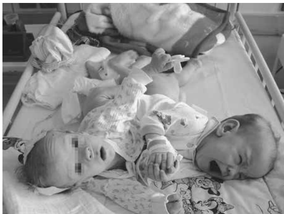
Rycina 11. Zrosłaki – jeden organizm, dwie różne osobowości

są aspekty psychologiczno-etyczne. Przez wiele tygodni, miesięcy, a czasem nawet lat, zespół leczący bliźnięta syjamskie nawiązuje szczególnie, bardzo bliski kontakt z dziećmi. Dokładne zrozumienie „wyjątkowości” zrosłaków wyzwała wielokrotnie większe zaangażowanie uczuciowe ze strony personelu leczącego niż w przypadku innych małych pacjentów. Spotyka się ono z wzajemnością ze strony bliźniąt, które lekarzy i pielęgniarki traktują jak najbliższe osoby. Biologiczni rodzice, z przyczyn często od nich niezależnych, nie przebywają z nimi codziennie. W takiej sytuacji również każde niepowodzenie w leczeniu jest szczególnie przeżywane przez zespół leczący [4].