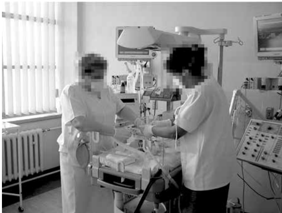
Rycina 1. Pielęgnacja zrosłaków wykonywana zawsze przez dwie pielęgniarki

W początkowym okresie pobytu na OIT zrosłaki planowane do późniejszego rozdzielenia, jak również te, których rozdzielenie nie jest możliwe, stwarzają trudności w czasie leczenia, a opieka nad nimi sprawia podobne problemy. W pierwszym okresie wykonywane są podstawowe zabiegi pielęgnacyjne oraz diagnostyka wady. W przypadku zrosłaków znajdujących się w stanie zagrożenia życia i których konfiguracja anatomiczna wady stwarza możliwość przeprowadzenia zabiegu rozdzielenia, diagnostyka jest z reguły zawężona, co wynika z ograniczeń czasowych i składa się najczęściej z oznaczenia grupy krwi, podstawowych badań laboratoryjnych, rentgenowskich zdjęć przeglądowych całych sylwetek dzieci oraz badań ultrasonograficznych [1, 4–8].