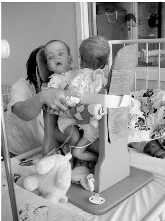
Rycina 7. Pionizacja zrosłaków w specjalnych „konstruowanych na miarę” fotelikach

Po operacji rozdzielania wskazane jest utrzymanie inwazyjnego monitorowania czynności życiowych operowanych bliźniąt. W celu przywrócenia i utrzymania homeostazy ustrojowej przez pierwsze kilkadziesiąt godzin po rozdzielaniu konieczna jest stała ocena kliniczna dzieci oraz częste