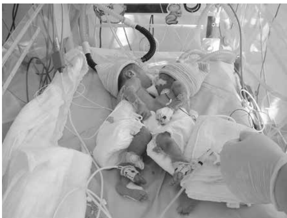
Rycina 2. Opieka nad zrosłakami na OIT

Pielęgnacja bliźniąt syjamskich, zwłaszcza przed operacją rozdzielenia, wymaga od zespołu pielęgniarskiego OIT szczególnego wysiłku, który ma na celu zapewnienie prawidłowej opieki nad tym niezwykłym typem pacjenta. Niezwykłym, ponieważ jednocześnie, równocześnie należy troszczyć się o dwoje złączonych dzieci — dwa niezależne życia — co zawsze stawia szczególne wymagania przed zespołem leczącym oraz powoduje konieczność stosowania specjalnej pielęgnacji i zabiegów leczniczo-rehabilitacyjnych [3–5] (ryc. 1–4).