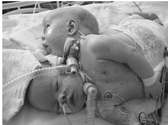
Rycina 10. Zroślaki typu thoracoomphalopagus

jamskich jest z reguły prawidłowa, gdyż większość zroślaków ma je prawidłowo rozwinięte. Najczęściej jest to jedyna dla nich możliwość fizycznego poznawania najbliższego otoczenia. Rozwój mowy i reakcji emocjonalnych zroślaków jest zazwyczaj prawidłowy, pod warunkiem zapewniania im stałego kontaktu słownego i wzrokowego.