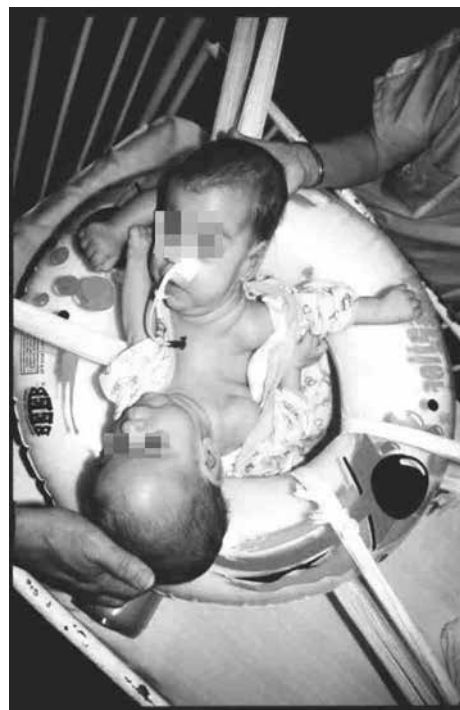
Rycina 4. Zabiegi rehabilitacyjne na OIT