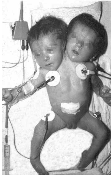
Rycina 9. Zroślaki typu dicephalus dipus dibrachius

Niemowlęta i małe dzieci do prawidłowego rozwoju psychoruchowego wymagają odpowiedniego napływu bodźców ze świata zewnętrznego. Zroślaki nie mogą być noszone na rękach jak zdrowe niemowlęta. W celu prawidłowego rozwoju są więc „uzależnione” od dodatkowych bodźców z zawężonego otoczenia. Obowiązek dostarczania bodźców spoczywa na personalu OIT. Bardzo ważne w rozwoju małego dziecka czynności, jak samodzielne przekręcanie się, zdolność samodzielnego siedzenia i stania u zroślaków nie są możliwe lub znacznie ograniczone. Należy pamiętać o wczesnej i systematycznej rehabilitacji, której celem poprzez odpowiednie ćwiczenia jest rozwój i wzmacnianie mięśni. Niektóre postaci bliźniąt syjamskich, na przykład thoracopagus , wymagają konstruowania specjalnego aparatu, który pomaga im utrzymywać pozycję siedzącą. W tym celu można wykonać różnego rodzaju podtrzymujące poduszki. Dla zroślaków typu ischiopagus konieczne jest zastosowanie specjalnie przygotowanych podpórek umożliwiających stanie. Koordynacja ruchowa kończyn górnych bliźniąt sy-