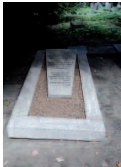
Grób Bolesława Wicherkiewicza – przed renowacją i po renowacji