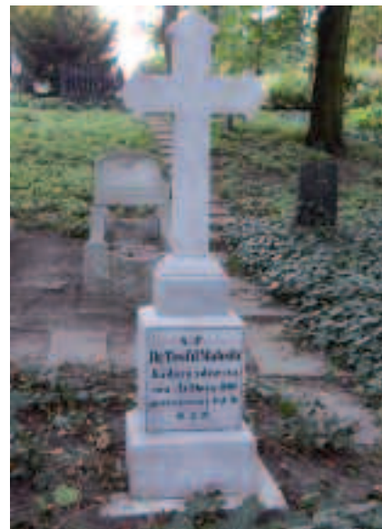
Grób Teodora Teofila Mateckiego – przed renowacją i po renowacji