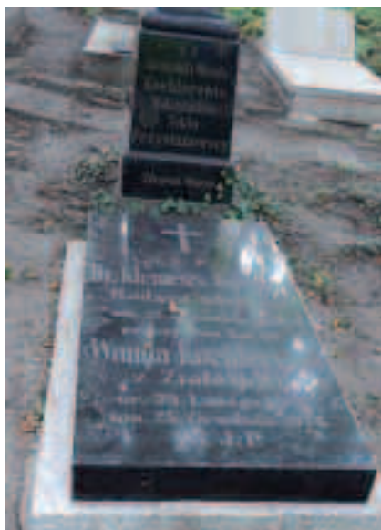
Grób Klemensa Koehlera – przed renowacją i po renowacji