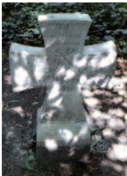
Grób Antoniego Jagielskiego – przed renowacją i po renowacji