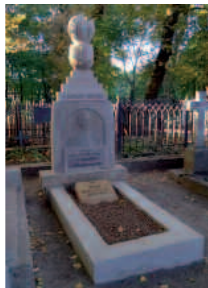
Grób Ksawerego Zakrzewskiego – przed renowacją i po renowacji