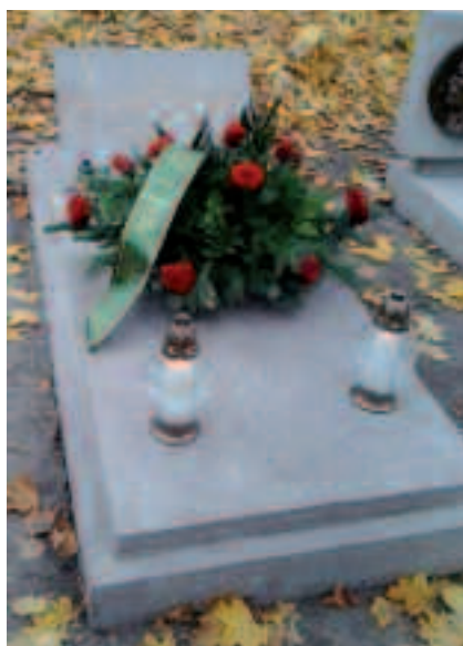
Grób Bolesława Krysiwicza – przed renowacją i po renowacji