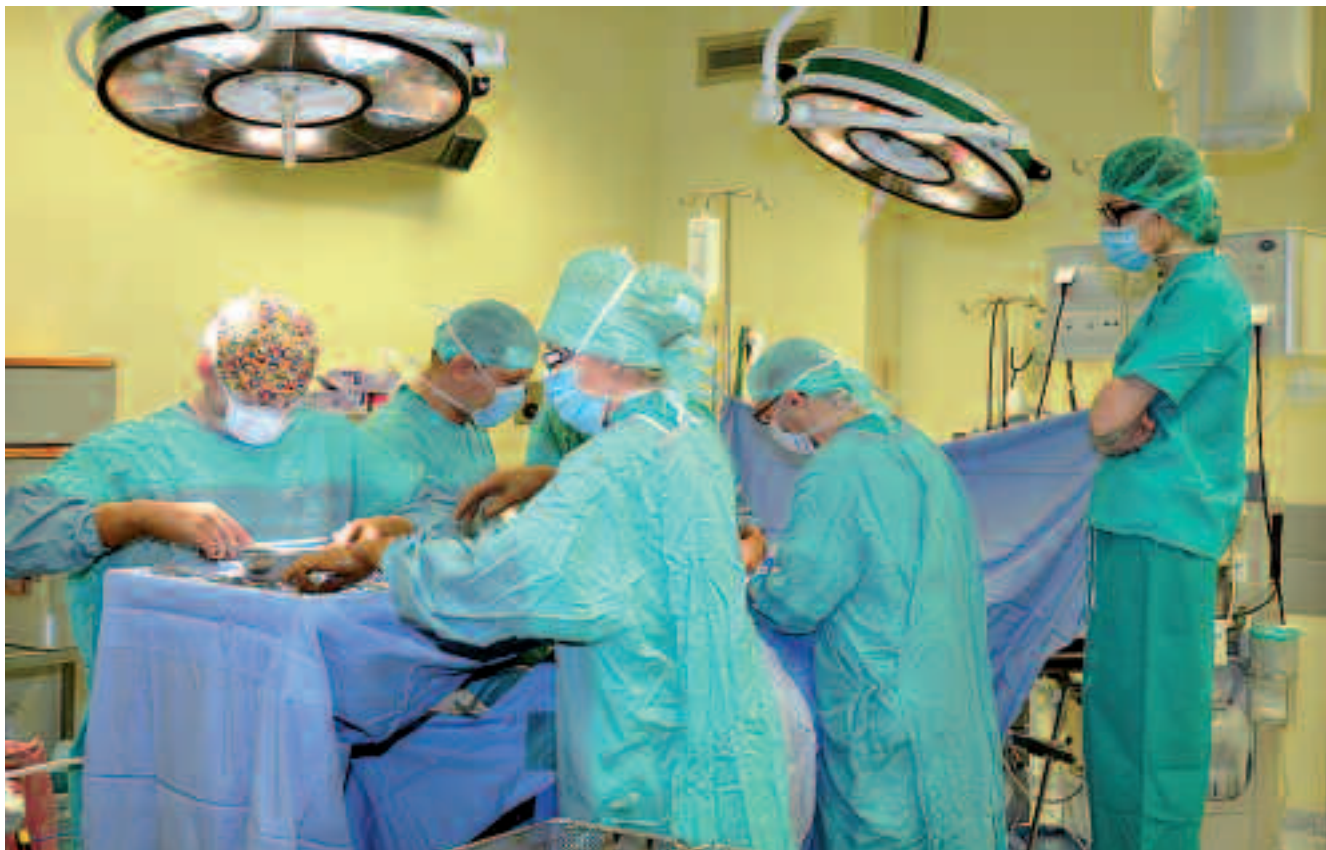
FOT. ANDRZEJ PIECHOCKI

pii Gdańskiego Uniwersytetu Medycznego, wyrażonym w artykule Karoliny Kowalskiej („Wprost” nr 5, 26 stycznia – 1 lutego 2015 r.): „pakiet jest pełen absurdów. Ostrzegałem o tym rządzących na 70 stronach uwag do ich siedmiostronicowej ustawy, ale nikt nie chciał mnie słuchać. Pakiet to porażka, o czym wielokrotnie ostrzegałem parlamentarzystów i ministerstwo. Już dziś sytuacja jest zła, a niedługo będzie jeszcze gorsza”.