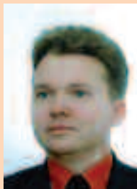
DR HAB. JĘDRZEJ SKRZYPCZAK

N a wstępie przypomnijmy, iż zgodnie z art. 9 Kodeksu Etyki Lekarskiej „Lekarz może podejmować leczenie jedynie po uprzednim zbadaniu pacjenta. Wyjątki stanowią sytuacje, gdy porada lekarska może być udzielona wyłącznie na odległość”. Takie brzmienie przepisu, zwłaszcza drugie zdanie, może budzić wątpliwości w praktyce. Dlatego warto zaprezentować sytuację, w której to okręgowy sąd lekarski umorzył postępowanie (a nie uniewinnił) w sprawie o ukaranie lek. X, obwinionego o wydanie telefonicznego zlecenia podłączenia kroplówki naskurczowej bez uprzedniego zbadania pacjentki A. przebywającej 14 listopada 2008 r. w izbie porodowej w G. – tj. o naruszenie ww. art. 9 KEL. W uzasadnieniu postanowienia OSL wskazał, że niewielki jest związek przyczynowo-skutkowy między podłączeniem kroplówki z oksytocyną po zleceniu telefonicznym przez obwinionego a zatrzymaniem łożyska prawidłowo usadowionego po porodzie i jego następstwami. Co ciekawe, zważywszy na decyzję o umorzeniu postępowania, wziął pod uwagę przyznanie się obwinionego do nieprawidłowego postępowania w postaci telefonicznego zlecenia podłączenia kroplówki naskurczowej oraz okoliczność jego przyjazdu do izby porodowej i nadzorowanie porodu. W zażaleniu na to postanowienie wskazano, że wbrew