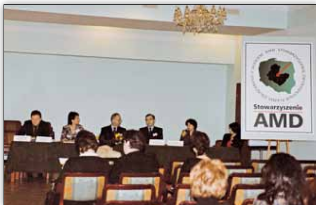
Ryc. 3. Obrady „okrągłego stołu”.