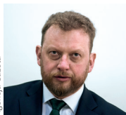
SZUMOWSKI ZWIĘKSZA „produkcję lekarzy”

Ministerstwo Zdrowia zwiększa liczbę miejsc na studiach medycznych. Projekt rozporządzenia w sprawie limitu przyjęć na kierunku lekarski i lekarsko-dentystyczny w roku akademickim 2018/2019 zakłada, że limit miejsc wyniesie 9211, w tym 7816