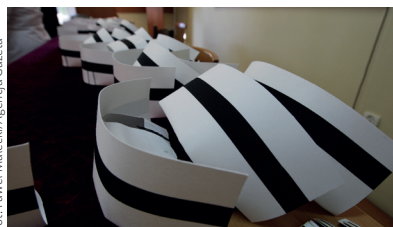
NORMY ZATRUDNIENIA pielęgniarek

Pielęgniarki doczekają się w końcu norm zatrudnienia opartych na konkretnych wskaźnikach. Resort zdrowia przygotował rozporządzenie, które ma zrealizować ten od dawna zgłaszany przez nie postulat. Normy mają zacząć obowiązywać jak najszybciej. Szpitale potrzebują jednak czasu, by dostosować się do nowych wymogów. Pielęgniarki od lat domagają się wprowadzenia wskaźnika powiązanego z liczbą łóżek. Na oddziałach zachowawczych wynosiłby on 0,6, na zabiegowych – 0,7, a na dziecięcych – 0,8. Takie zapisy znalazły się w projekcie rozporządzenia w sprawie świadczeń gwarantowanych z zakresu leczenia szpitalnego przygotowanym przez resort zdrowia.