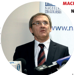
MACIEJ HAMANKIEWICZ, PREZES NACZELNEJ IZBY LEKARSKIEJ:

Ukraińscy lekarze to panaceum na niedostatki systemu ochrony zdrowia? Na pewno nie. Gdyby z obecnie zatrudnionych lekarzy zdjąć obowiązki biurokratyczne, które mogłaby wykonywać sekretarka medyczna, kto wie, może nie trzeba by liczby lekarzy tak znacząco powiększać. Jeśli będziemy im tych obowiązków dokładać, to nie wystarczy nawet podwojenie ich liczby.