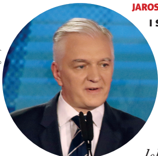
JAROSŁAW GOWIN, MINISTER NAUKI I SZKOLNICTWA WYŻSZEGO:

Minister Szumowski zwrócił się do mnie z postulatem uproszczenia procesu nostryfikacji dyplomów lekarzy z krajów nienależących do Unii