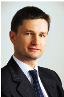
fol. Archiwum Lux Med