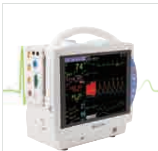
BSM-6501K (12" LCD)