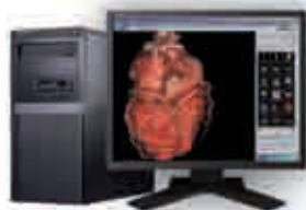
Image Management beyond Radiology systemy archiwizacji RIS/PACS

nowoczesne systemy przetwarzania danych obrazowych