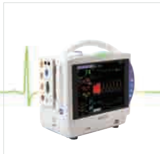
BSM-6301K (10" LCD)