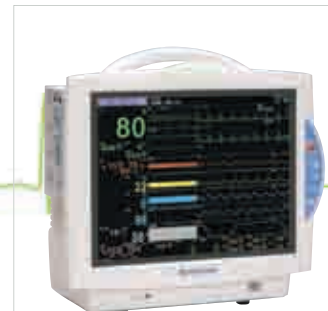
BSM-6701K (15" LCD)